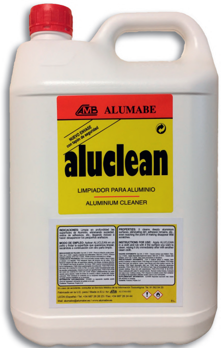
ENVASE 5 litros Ref: ALUC-05L