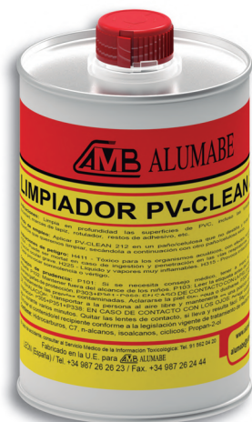
ENVASE METÁLICO 500 ml Ref: PV-CL212

Líquido que limpia en profundidad las superficies de PVC, incluso las foliadas.