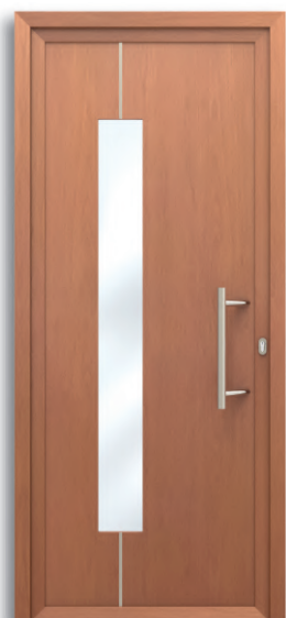
Milán Ref: PFMI-