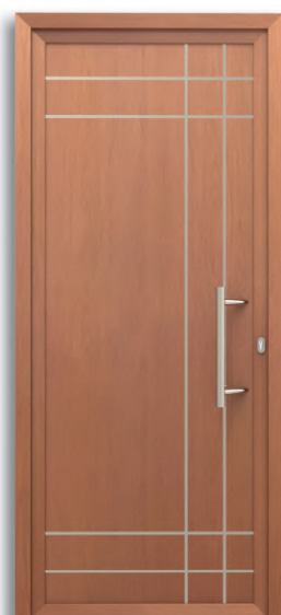
Ginebra Ref: PFGI-