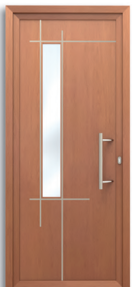
Graz Ref: PFGRA-