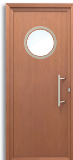
Gante Ref: PFGA-