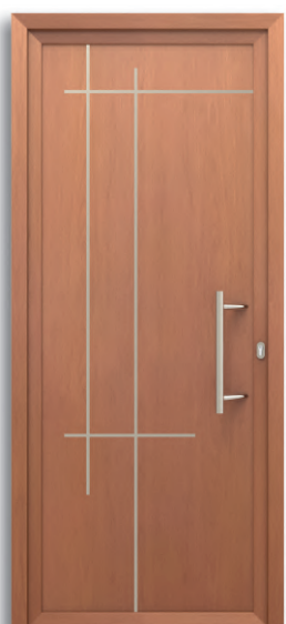
Linz Ref: PFLIN-