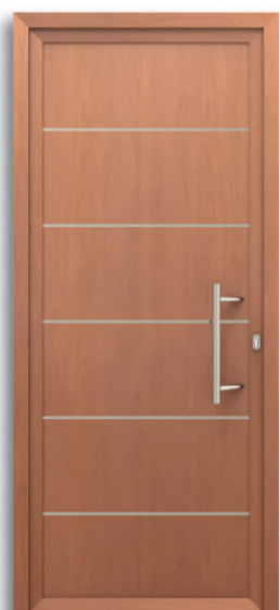
Londres Ref: PFLO-