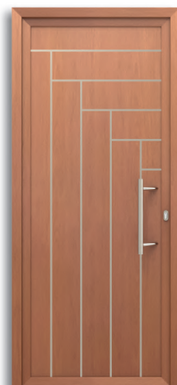
Oporto Ref: PFOP-