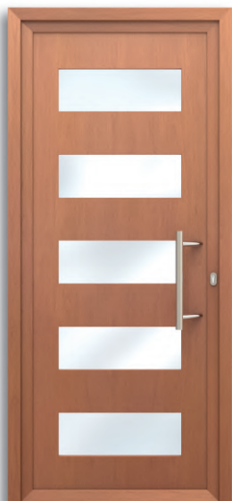
Lyon Ref: PFLY-