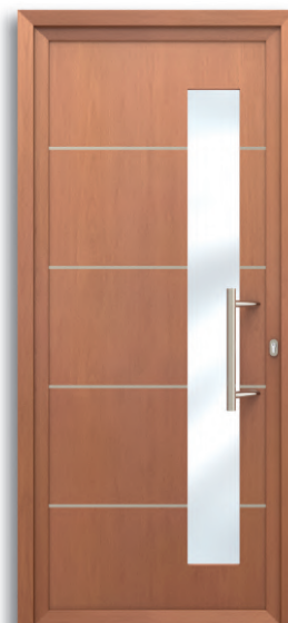
Ancona Ref: PFAN-