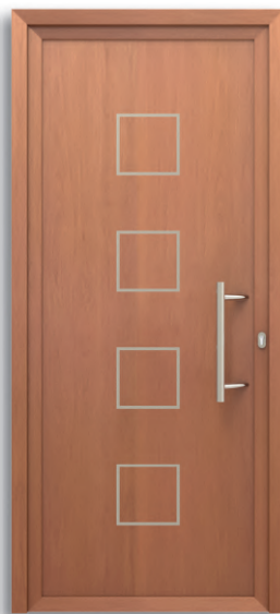
Berlín Ref: PFBE-