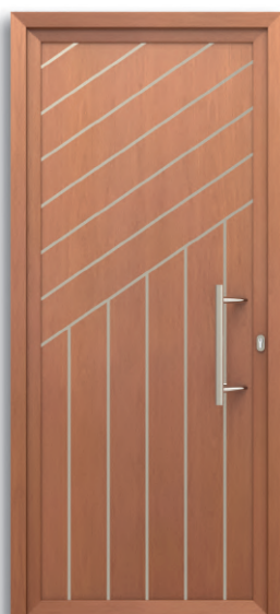
Coímbra Ref: PFCO-