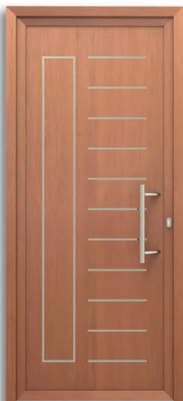
Turín Ref: PFTU-