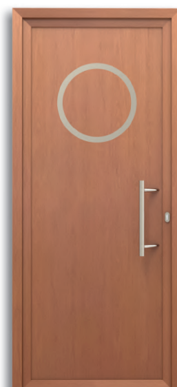
Namur Ref: PFNA-