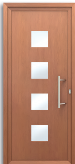
Bonn Ref: PFBO-