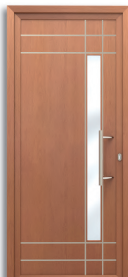
Lucerna Ref: PFLU-