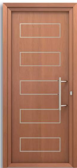
París Ref: PFPA-