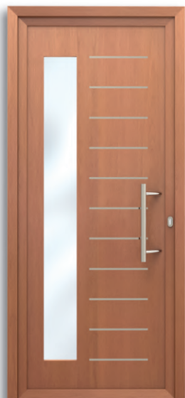
Bolonia Ref: PFBOL-