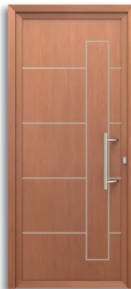
Nápoles Ref: PFNAP-