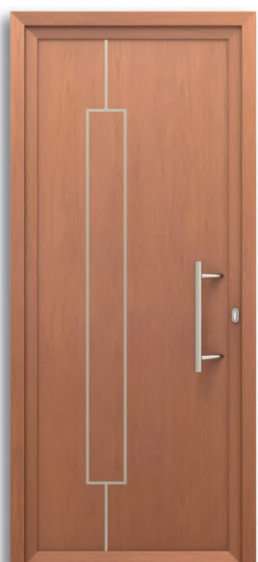
Roma Ref: PFRO-